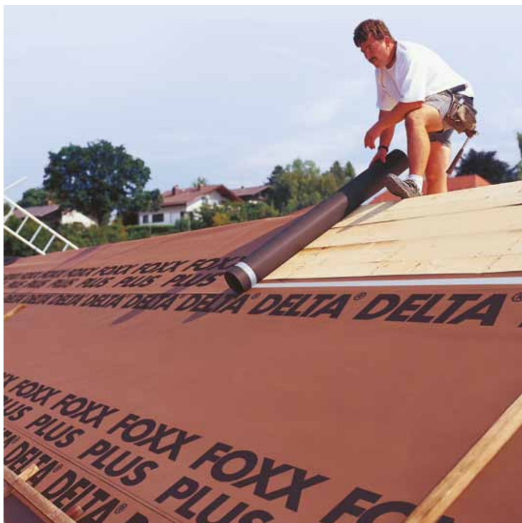
Плётка DELTA®-FOXX PLUS сохраняет вашу мансарду комфортной и сухой на весь срок эксплуатации.