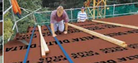
Водонепроницаемость благодаря интегрированным лентам. Уплотнение мансардного окна.