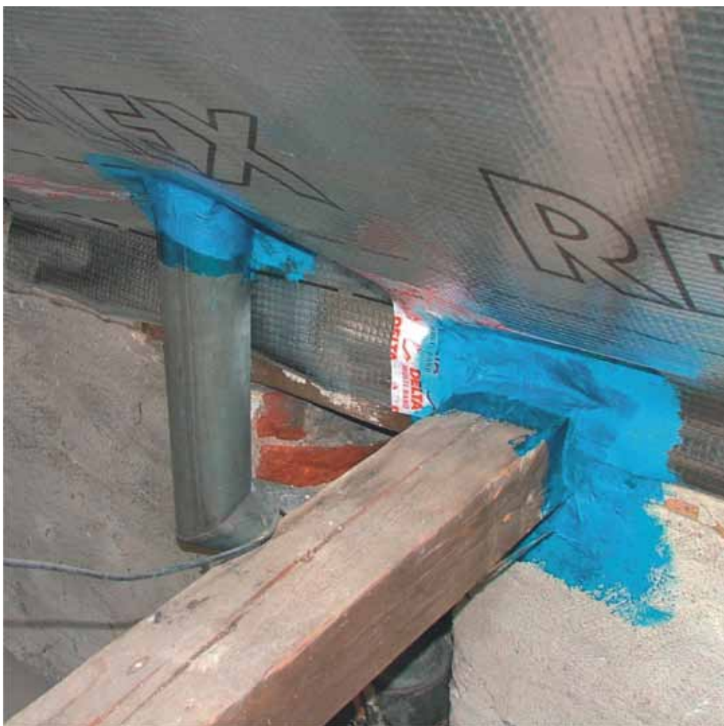
DELTA®-LIQUIXX наносится быстро и легко в самых труднодоступных местах крыши.