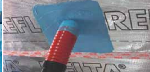
Герметизация вентканала при новом строительстве.