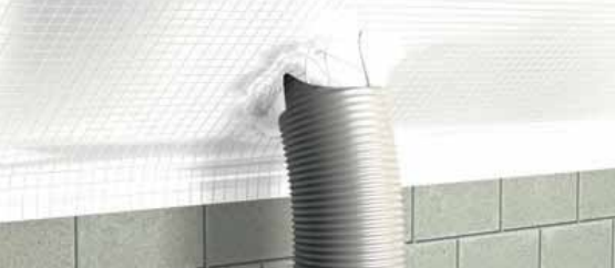
Пароизоляция DELTA® заводится на проходку.