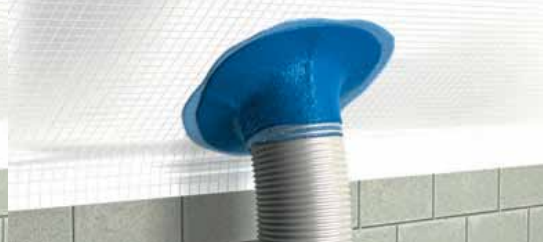
Наносится завершающий слой пасты – примыкание готово!