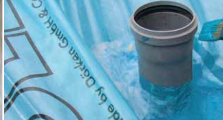
Уплотнение кровельной проходки при реконструкции.