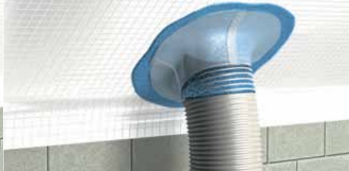
Наносится первый слой DELTA®-LIQUIXX с армирующей тканью.