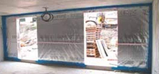
Устройство примыкания пароизоляции стены.